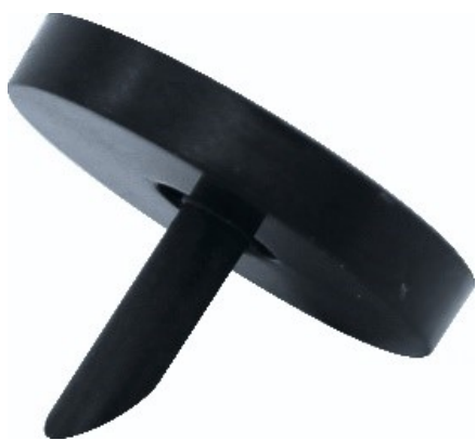
Art.Nr. 815000 KEIMARME FLASCHENBELÜFTUNG mit PTFE Membranen Filter

Weitergehende Hinweise oder Beratung über die Handhabung erhalten Sie durch Ihren Händler. Bei Reklamationen oder Ersatzteillieferungen wenden Sie sich ebenfalls an Ihren Händler. Bitte halten Sie dafür Artikelbezeichnung, Kaufdatum und ggf. Seriennummer bereit, damit eine reibungslose Ersatzteillieferung/ Reklamationsabwicklung gewährleistet werden kann. Im Rahmen der technischen Weiterentwicklung behalten wir uns Änderungen vor, die der Produktverbesserung dienen.